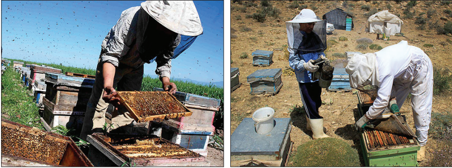
شکل (۱۰) - برداشت عسل

قطعاً آثار مواد شیمیایی به هنگام آزمایش عسل در آزمایشگاه، تشخیص داده می‌شود. در نگهداری عسل ارگانیک رطوبت، حرارت و نور انبار نیز باید تحت کنترل باشد. عسلی که بر اساس روش کشاورزی ارگانیک استحصال و بسته‌بندی شده است، بعد از آن نیز باید در حفظ کیفیت آن دقت شود.