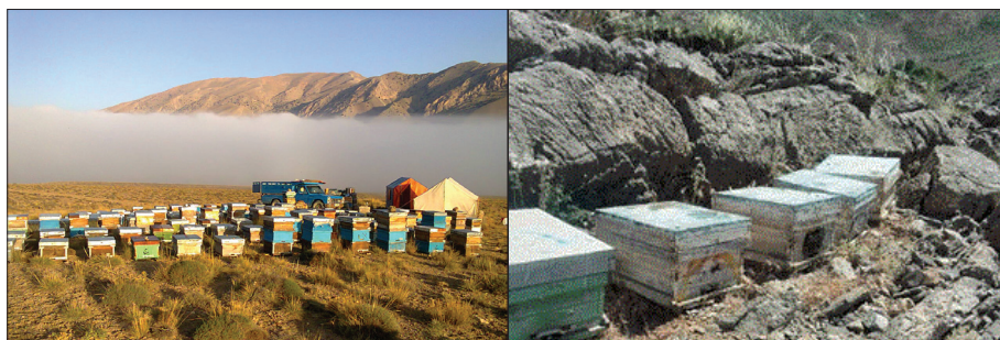
شکل (۴) - زنبورستان در محیط‌های طبیعی و بدون مواد شیمیایی

سیستم کشت و زرعی که در اطراف کندوها و حداقل در شعاع سه کیلومتری از آن قرار دارد، باید از تکنیک‌های کشاورزی ارگانیک تبعیت کند.