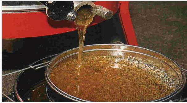
شکل (۱۱) - استحصال عسل