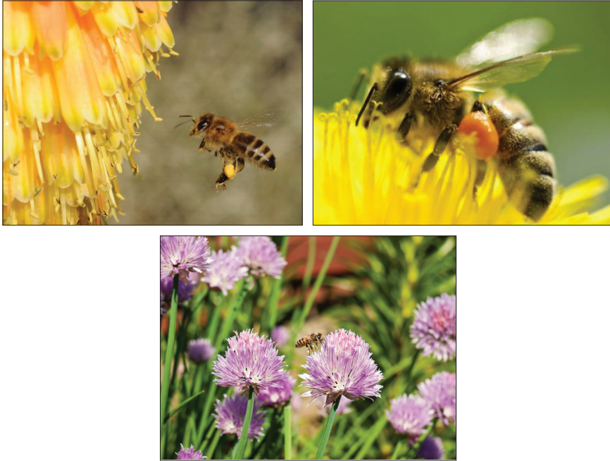
شکل (۶) - تغذیه کندوها در زنبورداری ارگانیک اهمیت ویژه‌ای دارد.