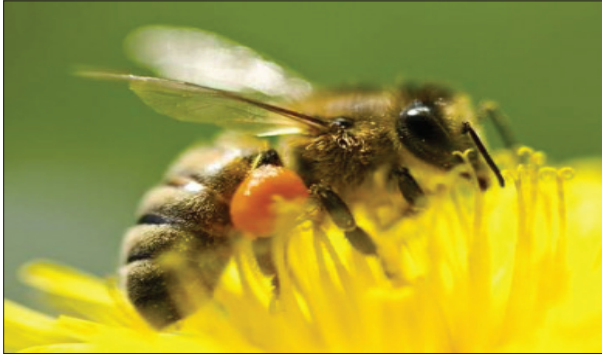
شکل (۹) - کنه واروا بر روی زنبور عسل بالغ

زمان اجرای مبارزه ابتدای فصل، یعنی تقریباً ابتدای بهار است.