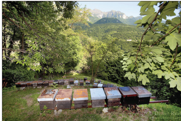
شکل (۱) - زنبورداری در محیط طبیعی

در کشاورزی ارگانیک به تمامی فعالیت‌های پرورش زنبور عسل به صورتی که ویژگی‌های طبیعی و عادی منطقه دستخوش تغییرات بشری نشود و هر مرحله از پرورش قابل کنترل و منطبق با استانداردهای بین‌المللی باشد، زنبورداری ارگانیک می‌گویند (شکل ۱).