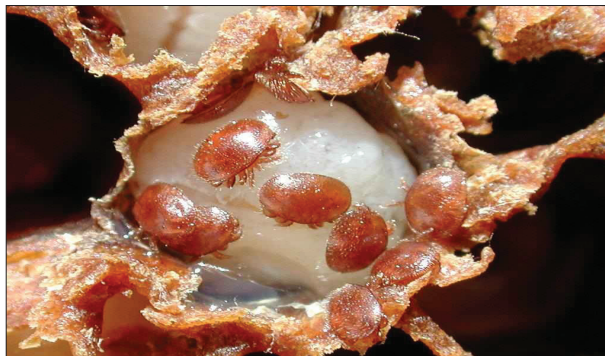
شکل (۸) - کنه واروا بر روی لاروهای زنبور عسل