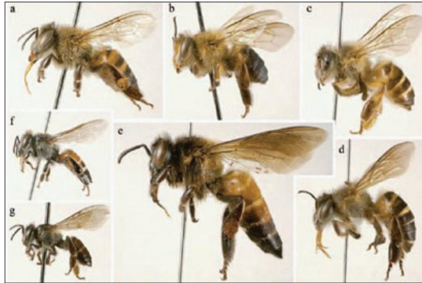
شکل (۲) - نژادهای زنبور در دنیا

در دنیا چهار گونه زنبور عسل وجود دارد: زنبور عسل کوچک، زنبور عسل بزرگ، زنبور عسل هندی در آسیا و زنبور عسل اروپایی در بیشتر نقاط جهان